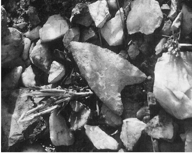
Werkplaats met pijlpunt.