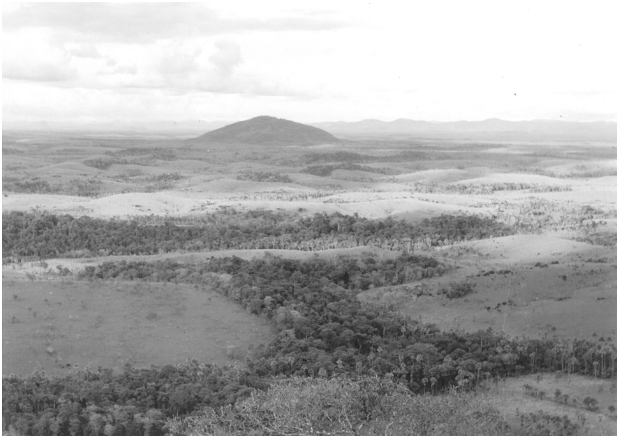
Sipaliwini Savanne met Morro Grande.

De aard van dit landschap wordt in de Encyclopedie van Suriname als volgt verwoord: Het grootste deel van het reservaat wordt gevormd door de savanne (630 km 2 ), een golvend heuvelachtig landschap van bijzondere schoonheid, 275-400 m. boven zeeniveau, op de meeste plaatsen bedekt met stenen en steenblokken. Het landschap wordt beheerst door het open “boomgaard-savannetype”: een merendeels uit (schijn)grassen bestaande lage kruidenvegetatie met verspreide bomen. In de kreekdalen staat Maurisiepalm-bos. Te midden van de savanne, die elke droge tijd verbrandt, liggen geïsoleerde bosresten. De Morro Grande (596 m.) en de Vier Gebroeders (554 m.) en enkele naamloze toppen in het zuiden rijzen als “Inselber-ge” boven het landschap uit.