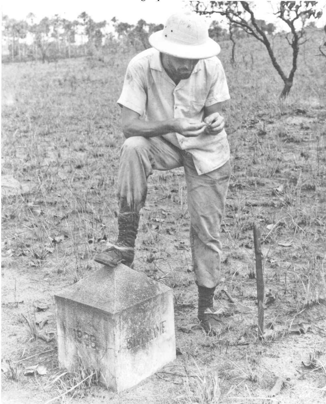
Geen slagbomen of douaneambtenaren. De auteur aan de grens.

We hebben er even voor stil gestaan, maar zijn toen bij afwezigheid van slagbomen en douaneambtenaren toch maar doorgelopen.