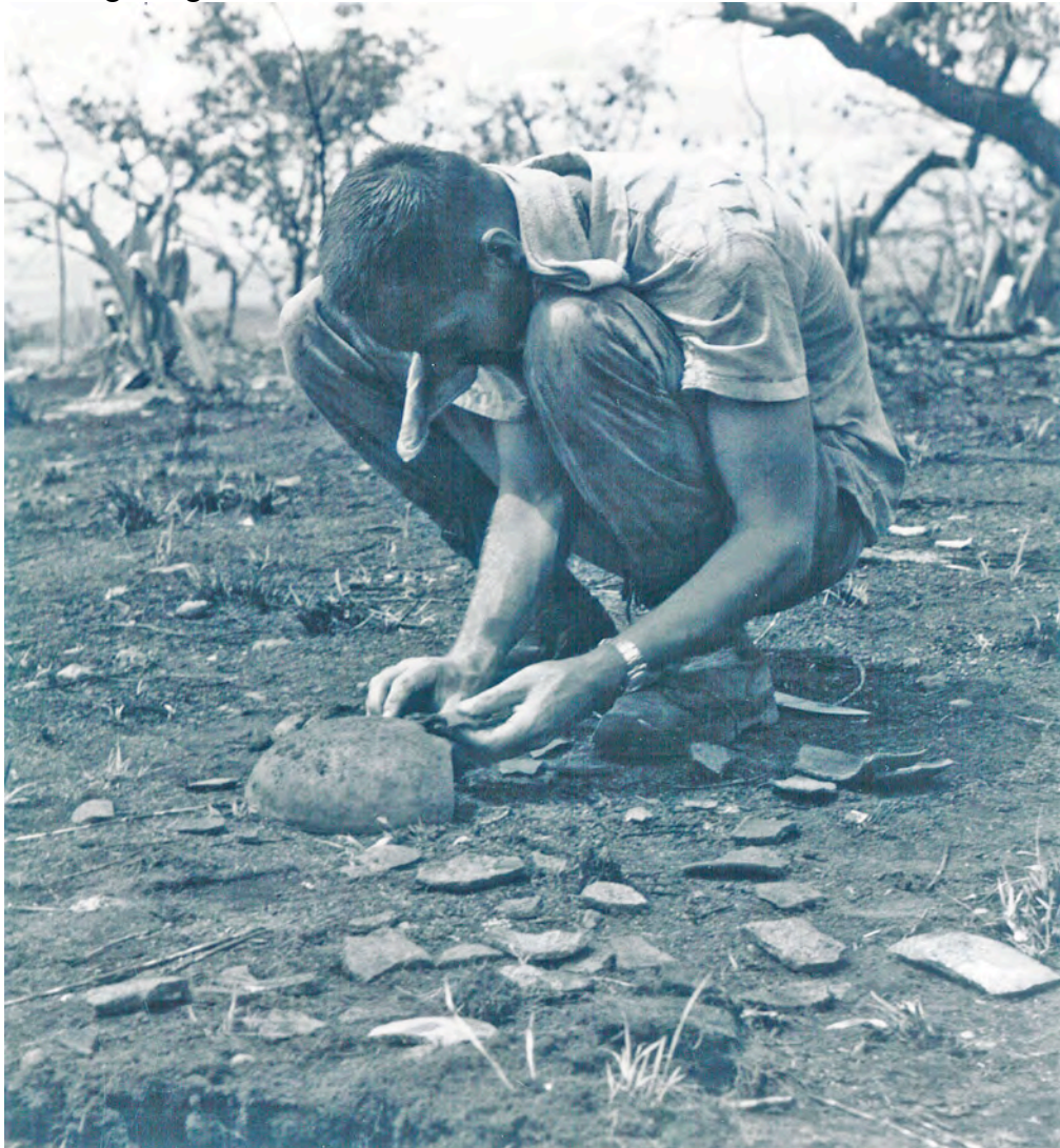
Bubberman als archeoloog.

Ik had in de loop dier jaren “het bos”, vooral als stille bewaarder van het verleden, ook goed leren “lezen en waarderen”, zodanig dat archeologie mijn hobby werd. In dit opzicht lag er toen nog een groot terrein braak in Suriname.