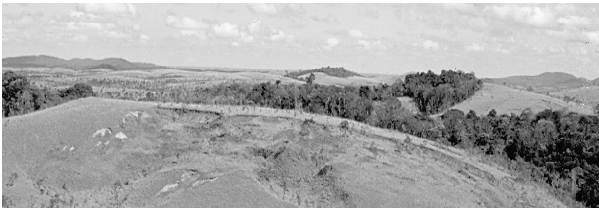
Nog nooit zag een Surinamer zoo wijd en ver over boschloos land.

De expeditiearts H. E. Rombouts zorgde voor de eerste imposante landschapsfoto's van dit gebied.