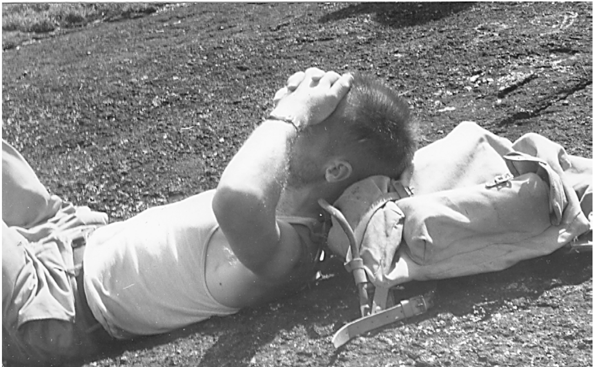
Echte voldoening... De auteur op de top van de Kantani