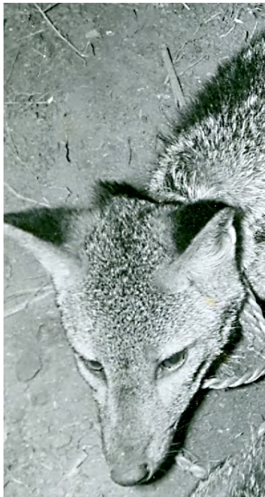
Levend gevangen savannahond.